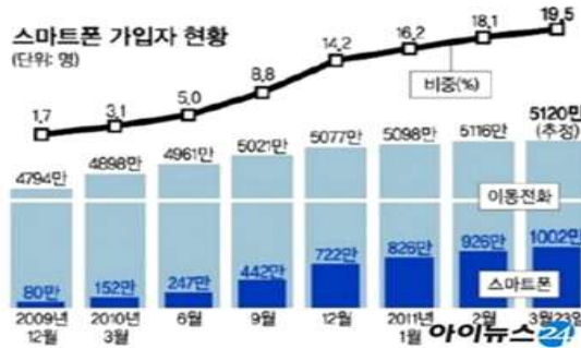
◁국내 스마트폰 가입자 현황